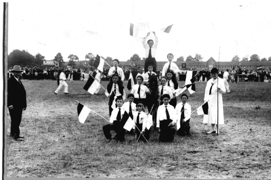
Provincial Turnier 1932 in Hamm. Kinder Voltigier Abtlg. des Reitervereins Hattingen u. Umgegend II. Preis.