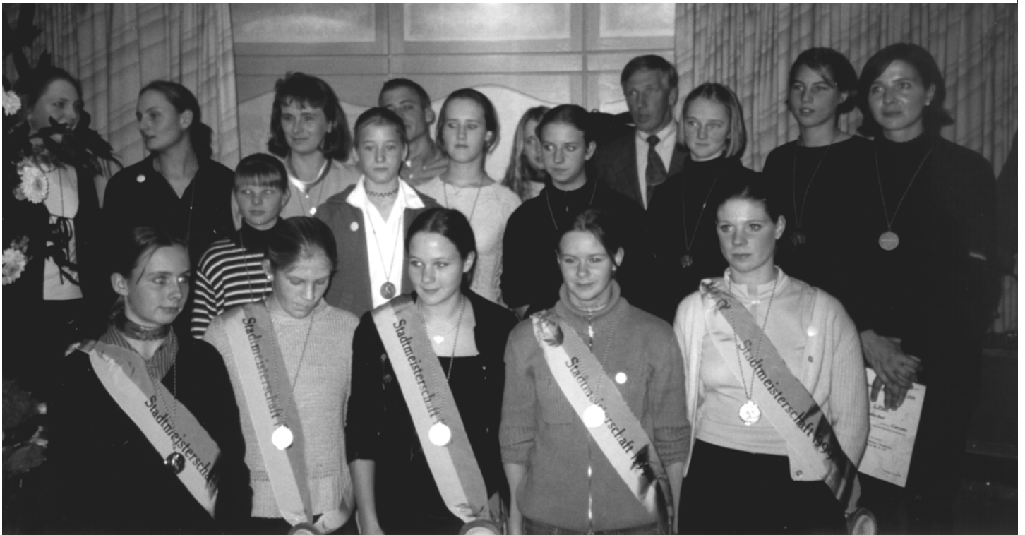
Gruppenfoto der Sieger und Plazierten der Stadtmeisterschaft 1999

ZRFV Hattingen stellt die Hälfte der Stadtmeister und Plazierten